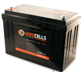
BT125.12 BT50.24 BT25.36